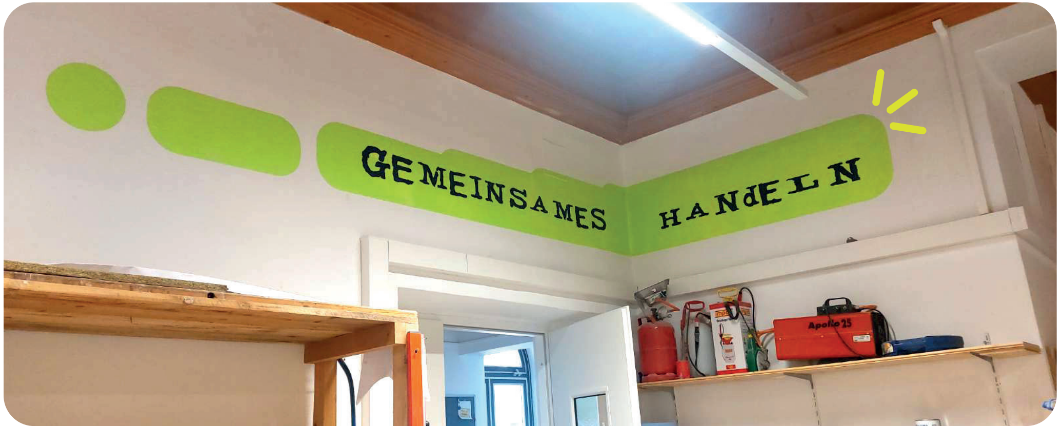
Gemeinsames Handeln, wichtig für die Mitarbeiter des Bildungszentrum Salzkammergut Projekt SPARTA.